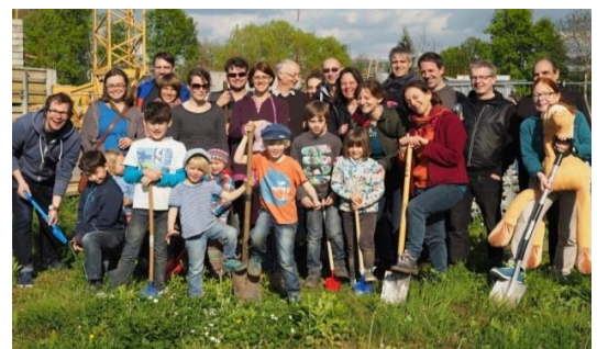
Erster Spatenstich Projekt Lamakat Juni 2016

Die Aktiven vom BAUVEREIN „Wem gehört die Stadt?“